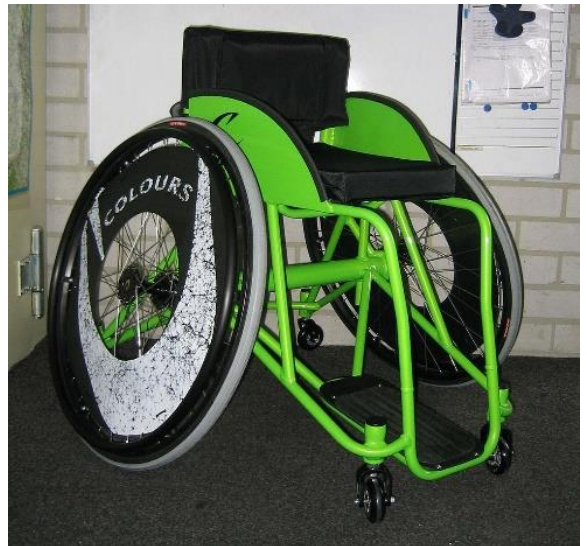
rolstoel voor rolstoelbasketbal